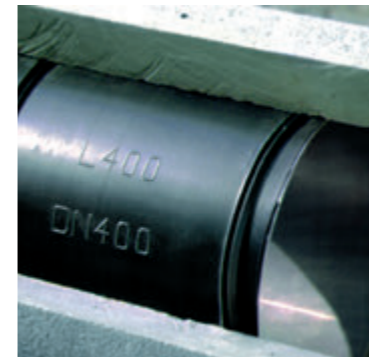
Quick-Lock-Manschette V4A und EPDM Dichtgummi

Sanierte Leitungen sind dicht, umweltfreundlich und verlängern die Lebensdauer der Kanalsysteme.